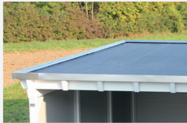
Dach-Wetterseite aus EPDM-Membrane