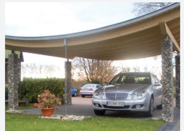
Carport Feng Shui Gabionenpfosten mit Steinen