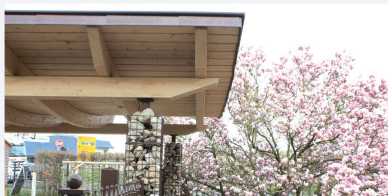
Doppel-Carport Feng Shui mit Kupfer-Blende