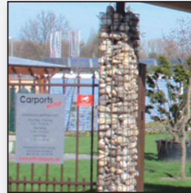
Die Gabionenpfosten werden mit Steinen nach Ihren Wünschen befüllt.