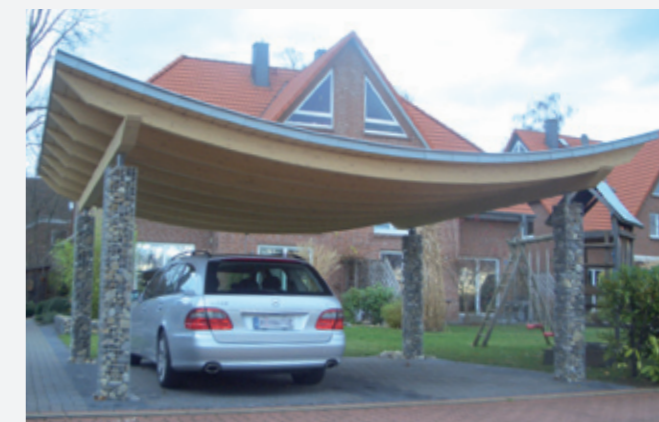
Hochwertige Leimholz-Konstruktion mit Gabionenpfosten