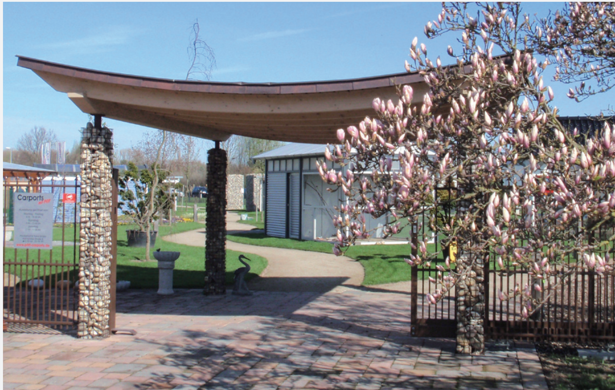
Carports Feng Shui