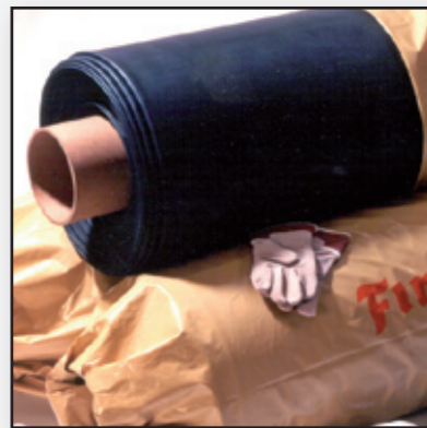
Firestone EPDM Dachbeschichtungen als Rollenware – Keine Naht, selbst bei großen Flächen